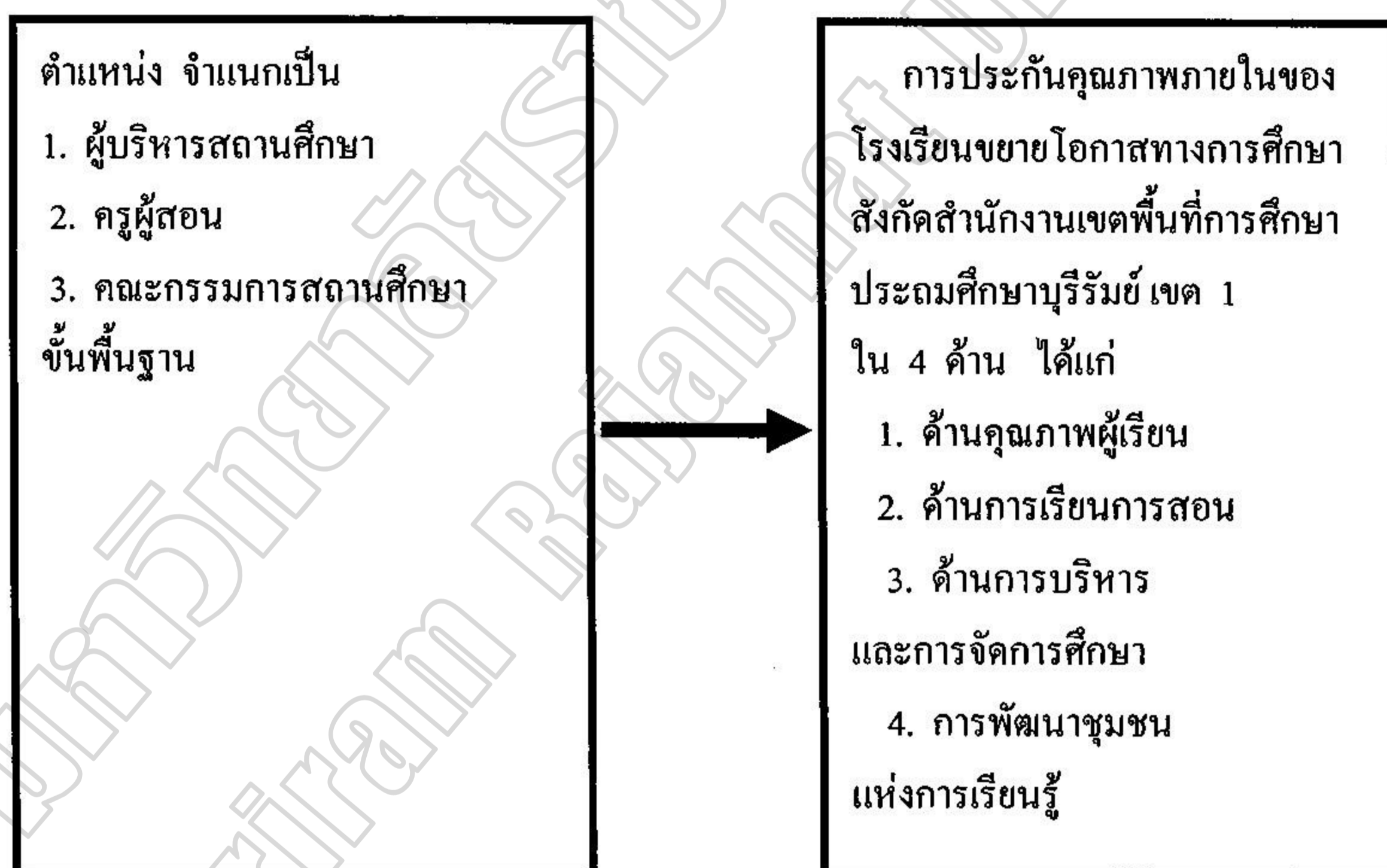
ภาพประกอบ 2 กรอบแนวคิดในการวิจัย