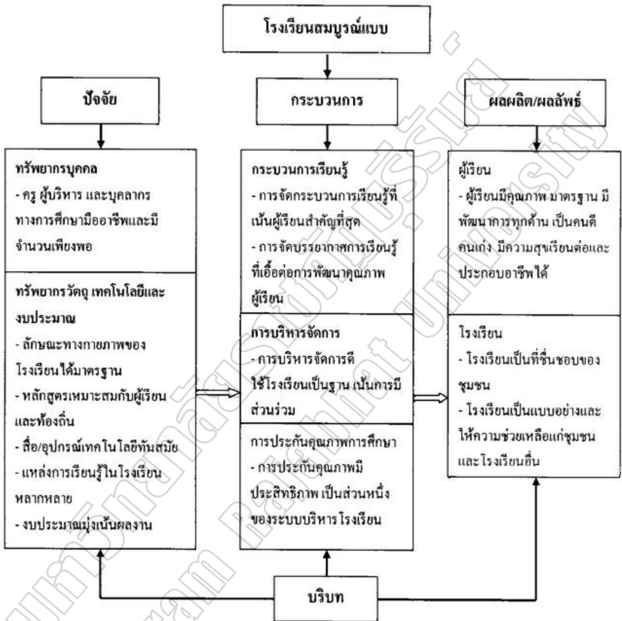
ภาพประกอบ 2.2 องค์กำหนดความเป็นโรงเรียนสมบูรณ์แบบ