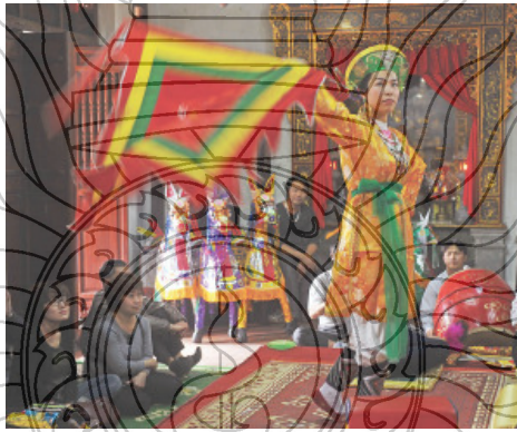
ภาพที่ 3 พิธีกรรมเลื่อนดวง ที่ถูกห้ามโดยระบอบคอมมิวนิสต์

วัฒนธรรมที่เกี่ยวข้องกับความเชื่อของเวียดนาม ในระบอบคอมมิวนิสต์ ถูกแทรกลงในวิถีชีวิตชาวเวียดนามอย่างหลบซ่อนอยู่เสมอ ที่ฝั่งทางไสยศาสตร์ ยังเป็นสิ่งที่ชาวเวียดนาม ใช้เป็นที่พึ่ง เช่น พิธี เลื่อนดวงการทำพิธีเลื่อนดวง สามารถช่วยคนที่มีความกังวล หรือเริ่มมีความผิดปกติทางจิต ชาวเวียดนามจะทำพิธีเลื่อนดวงเพื่อขจัดปัญหา และกลับมาใช้ชีวิตตามปกติของตน เมื่อสังคมพัฒนาขึ้น ความกดดันทางจิตใจก็เพิ่มเป็นทวีคูณ ความเครียดทวีความรุนแรงขึ้น ทำให้คนหันเข้าหาพิธีเลื่อนดวงมากขึ้น