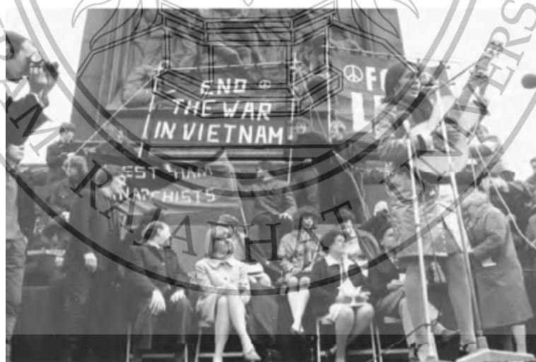
ภาพที่ 2 การชุมนุมและร้องเพลงต่อต้านสงครามเวียดนามของชาวอเมริกัน

เพลง War pig จากวง Black Sabbath กล่าวถึงสงครามเวียดนามผ่านบทเพลงมีความหมายว่า “บรรดานักการเมืองทั้งหลาย คือพวกเริ่มสงคราม แต่กลับไม่ได้ออกไปสู้รบด้วยตัวเอง และยังส่งคนจน ออกไปสู้แทน” Politicians hide themselves away. They only started the war Why should they go out to fight? They leave that role to the poor