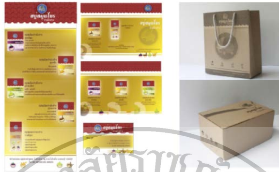
ภาพที่ 5 บรรจุภัณฑ์เพื่อการขนส่ง สพู่สมุนไพร บ้านโรงช้าง จังหวัดสิงห์บุรี