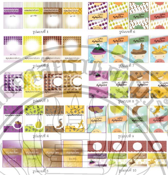
ภาพที่ 2 กราฟิกบนบรรจุภัณฑ์ พบว่า แบบที่มีความสวยงาม และมีสีที่สื่อถึงผลิตภัณฑ์ได้เป็นอย่างดี คือ แบบที่