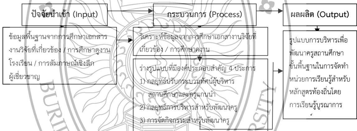
ภาพ 1 ร่างรูปแบบการบริหารสำหรับพัฒนาครูสถานศึกษาขั้นพื้นฐานในการจัดทำหน่วยการเรียนรู้สำหรับหลักสูตรท้องถิ่นโดยการเรียนรู้บูรณาการแบบองค์รวม

การวิจัยระยะที่ 1 การสร้างรูปแบบ เป็นการศึกษาปัจจัยและองค์ประกอบที่จะนำมาสร้างรูปแบบการบริหารเพื่อพัฒนาครูสถานศึกษาขั้นพื้นฐานในการจัดทำหน่วยการเรียนรู้สำหรับหลักสูตรท้องถิ่นโดยการเรียนรู้บูรณาการแบบองค์รวม ใช้การวิจัยเชิงคุณภาพ มีรายละเอียดดังนี้ 1) ศึกษาเอกสารและงานวิจัยที่เกี่ยวข้อง โดยศึกษาเกี่ยวกับรูปแบบแนวทางการพัฒนาครู การจัดทำหลักสูตรท้องถิ่น การจัดการเรียนรู้บูรณาการแบบองค์รวม 2) สัมภาษณ์เชิงลึกผู้เชี่ยวชาญที่เป็นผู้ทรงคุณวุฒิมีประสบการณ์เกี่ยวกับกระบวนการจัดทำหลักสูตรท้องถิ่นโดยการเรียนรู้บูรณาการแบบองค์รวม และปัจจัยที่จะทำให้ครูสามารถจัดทำหน่วยการเรียนรู้สำหรับหลักสูตรท้องถิ่นโดยการเรียนรู้บูรณาการแบบองค์รวม 3) สัมภาษณ์เชิงลึกผู้บริหารสถานศึกษา ครูผู้สอน โรงเรียนที่มีประสบการณ์ในการดำเนินงานจัดทำหลักสูตรท้องถิ่นโดยใช้การเรียนรู้บูรณาการแบบองค์รวม เกี่ยวกับกระบวนการที่ทำให้เกิดการสร้างหน่วยการเรียนรู้สำหรับหลักสูตรท้องถิ่นโดยการเรียนรู้บูรณาการแบบองค์รวม และ 4) รวบรวมข้อมูลที่ได้มาวิเคราะห์ความสัมพันธ์ ได้ร่างรูปแบบดังภาพ 1