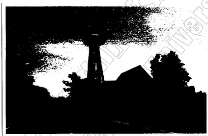
ภาพประกอบ 4.5 ประปาหมู่บ้านตำบลลำควน

6.3 การประปา ตำบลลำควนมีน้ำประปาบริการประชาชนในเขตองค์การบริหารส่วนตำบลลำควน ในรูปแบบประปาหมู่บ้านซึ่งยังต้องการการพัฒนาในด้านคุณภาพและปริมาณน้ำให้มีปริมาณเพียงพอกับความต้องการใช้ในหมู่บ้านและมีความสะอาดจนสามารถดื่มได้