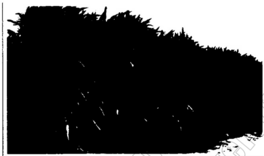
ภาพประกอบ 4.3 ไร่อ้อยของชาวบ้านตำบลลำควน