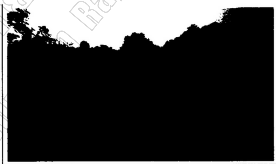
ภาพประกอบ 4.4 เส้นทางสัญจรระหว่างหมู่บ้าน

6.1 ถนน ได้แก่ ถนนลาดยาง จำนวน 3 สาย ถนนคอนกรีตภายในหมู่บ้าน จำนวน 46 สาย ถนนดิน จำนวน 5 สาย ถนนลูกรัง/หินคลุก จำนวน 35 สาย ถนนส่วนใหญ่เป็นถนนที่สร้างมานานแล้ว ทำให้สภาพถนนส่วนใหญ่เกิดความเสียหายไปตามกาลเวลา ทำให้การสัญจรไปมาไม่สะดวกเท่าที่ควร