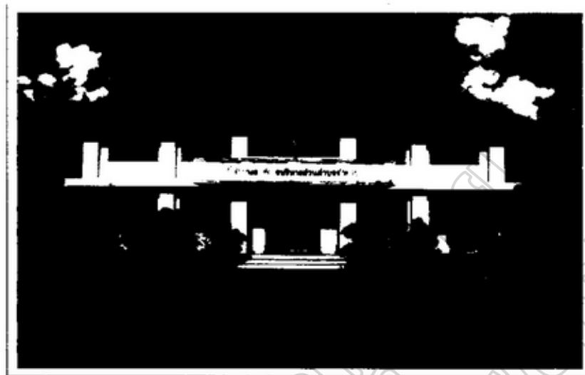
ภาพประกอบ 4.2 ที่ทำการองค์การบริหารส่วนตำบลลำควน