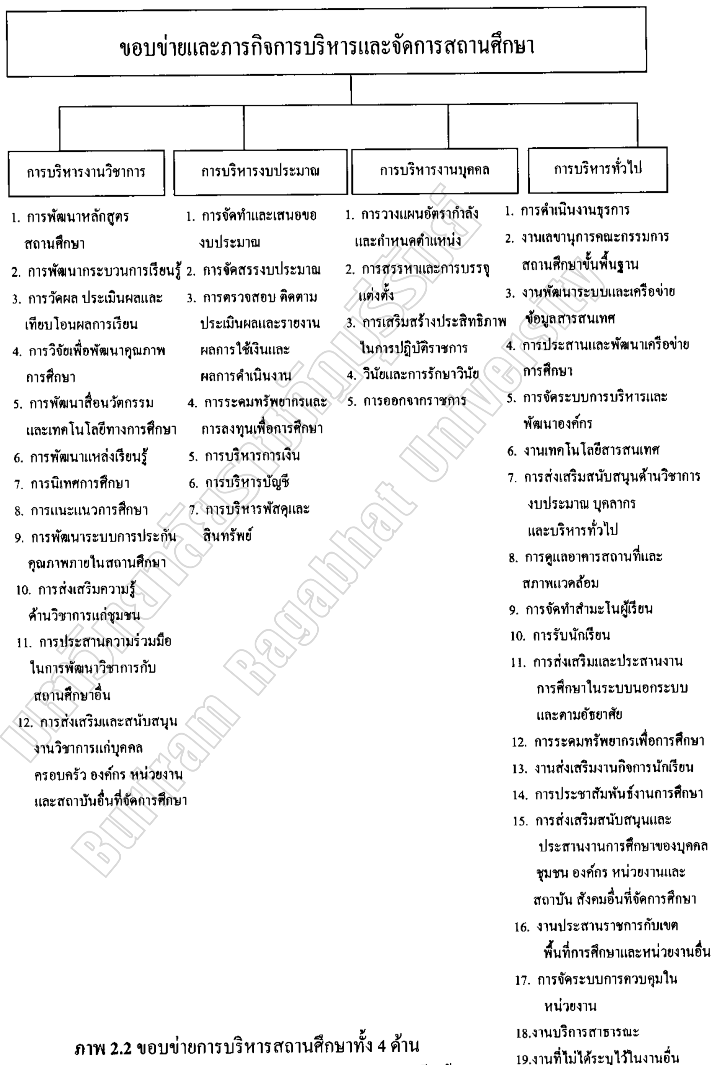
ภาพ 2.2 ขอบข่ายการบริหารสถานศึกษาทั้ง 4 ด้าน