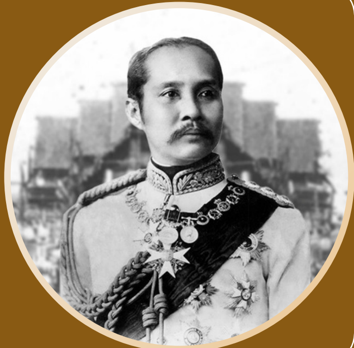
พระบาทสมเด็จพระ จุลจอมเกล้าเจ้าอยู่หัว