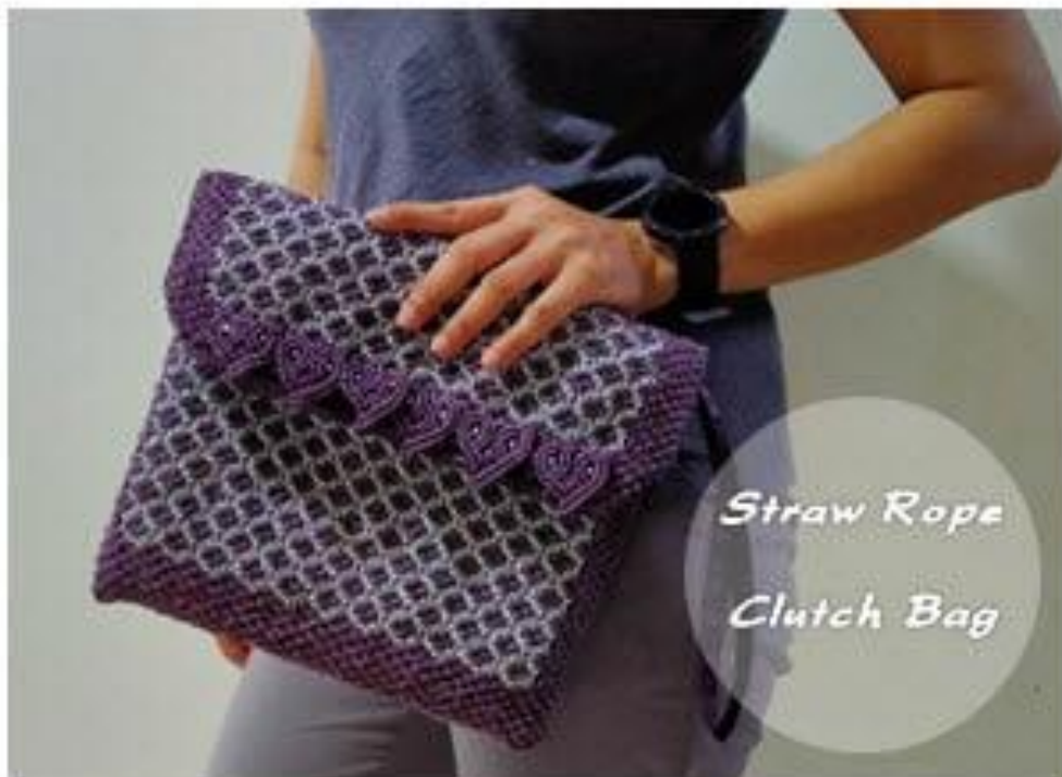
ภาพที่ ๑๑ ต้นแบบผลิตภัณฑ์