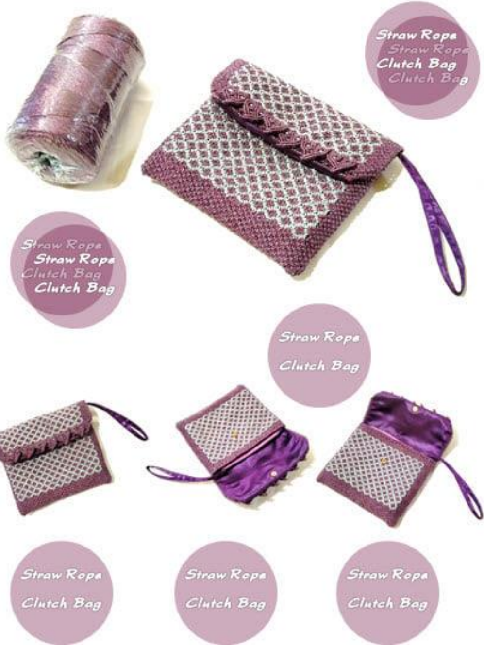
ภาพที่ ๑๐ ต้นแบบผลิตภัณฑ์