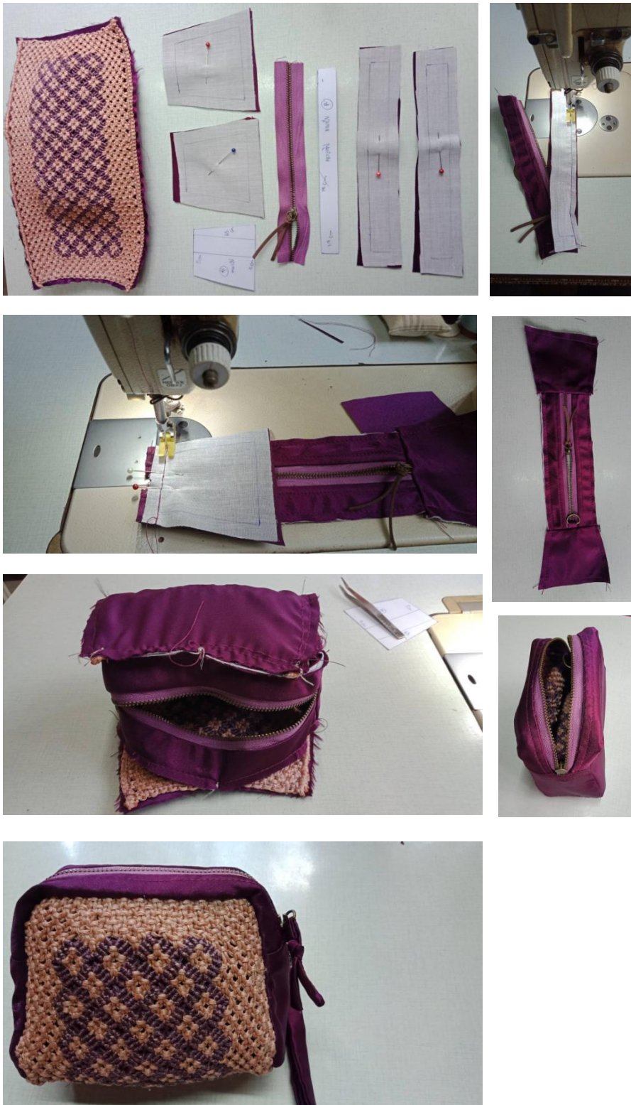
ภาพที่ ๙ การผลิตต้นแบบผลิตภัณฑ์