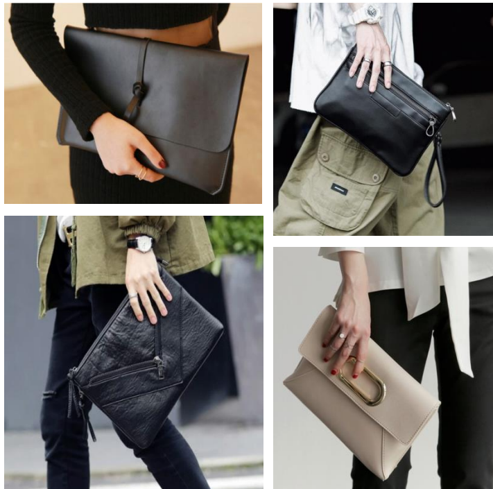
ภาพที่ ๔ สินค้าประเภทกระเป๋าถือในตลาดออนไลน์

ในการออกแบบผลิตภัณฑ์แปรรูปจากเชือกมัดฟางให้เป็นสินค้าที่สามารถใช้ในชีวิตประจำวันได้ มีแนวคิดในการพัฒนาเป็นสินค้าประเภทไลฟ์สไตล์ (Lift Style) ในยุคดิจิทัล ซึ่งส่วนใหญ่ใช้สมาร์ทโฟน อุปกรณ์อิเล็กทรอนิกส์ คอมพิวเตอร์พกพา IPAD หรือในชีวิตปกติใหม่ (New Normal) ซึ่งต้องพกหน้ากากอนามัย เจลล้างมือ แอลกอฮอล์ จึงจำเป็นต้องมีกระเป๋าถือเพื่อใส่อุปกรณ์เหล่านั้นในชีวิตประจำวันจนเป็นสินค้าแฟชั่น หรือแม้กระทั่งเป็นเครื่องแต่งกายในการออกงานกลางคืน หรือใส่อุปกรณ์เครื่องเขียน กระเป๋าเนกประสงค์ได้ โดยสินค้าที่มีอยู่ในตลาดมีทั้งวัสดุหนัง หนังเทียม ผ้า เชือกด้าย แต่เชือกมัดฟางยังไม่พบว่ามีผู้ผลิตออกสู่ท้องตลาด จึงเป็นโอกาสในการสร้างผลิตภัณฑ์ใหม่กระเป๋าถือเชือกมัดฟาง (Straw Rope Clutch Bag) ที่สะท้อนภาพลักษณ์งานหัตถกรรม ทักษะฝีมือในการถักเชือก สร้างความโดดเด่น และความทันสมัย