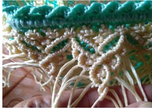
ภาพที่ ๒ วัสดุอุปกรณ์ในการผลิตตะกร้าเชือกมัดฟาง