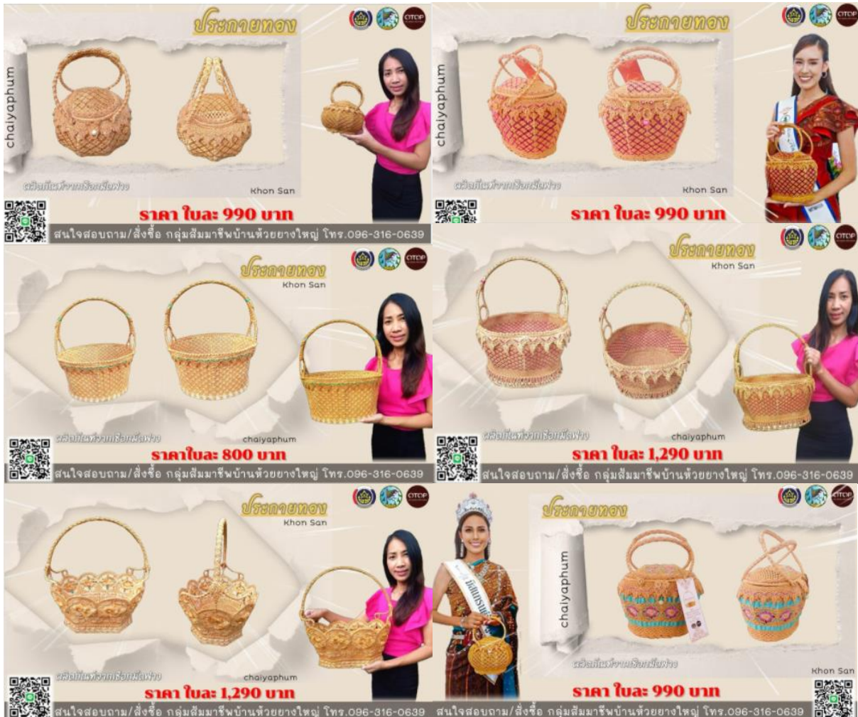
ภาพที่ ๑ ผลิตภัณฑ์เดิมของกลุ่มสัมมาชีพบ้านห้วยยางใหญ่ ที่มา : https://web.facebook.com/กลุ่มสัมมาชีพบ้านห้วยยางใหญ่ .

๒. ขาดโอกาสจากหน่วยงานภาครัฐ หรือองค์กรระดับจังหวัดในการโฆษณาประชาสัมพันธ์สินค้า หรือจัดแสดงสินค้าในวงกว้าง