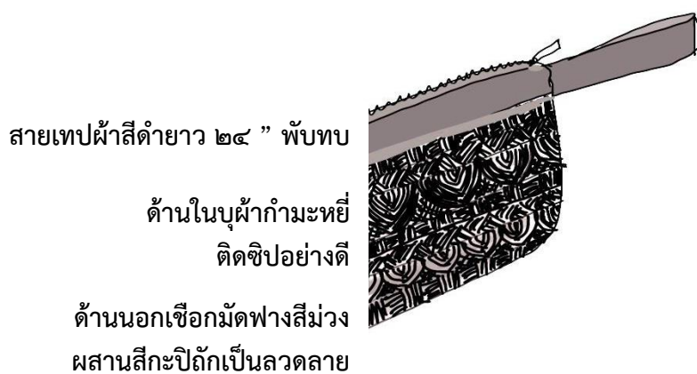
Type A : Straw Rope Clutch Bag

สายเทปผ้าสีดำยาว ๒๔ ” พับทบ ด้านในบุผ้ากำมะหยี่ ติดซีปอย่างดี ด้านนอกซ็อกมัดฟางสีม่วง ผสมสีปักเป็นลวดลาย