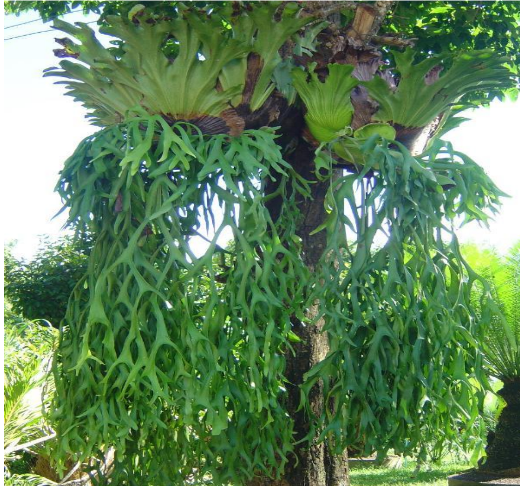
ชายผ้าสีดำ