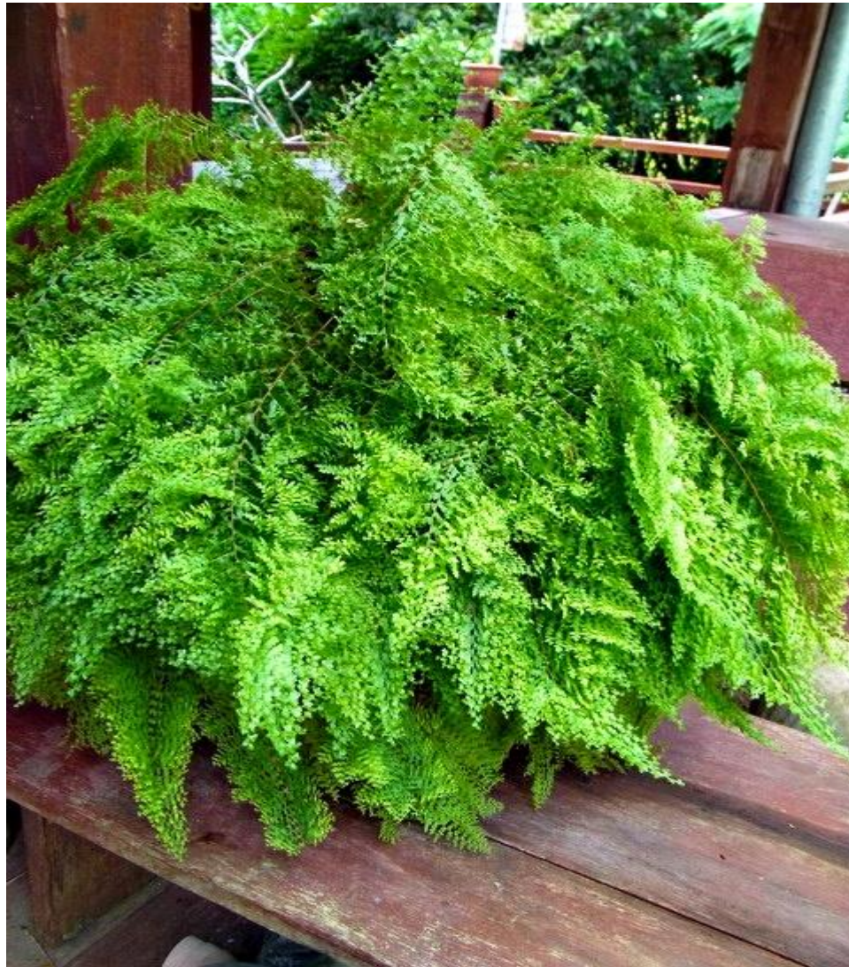
เฟิร์นก้านดำ