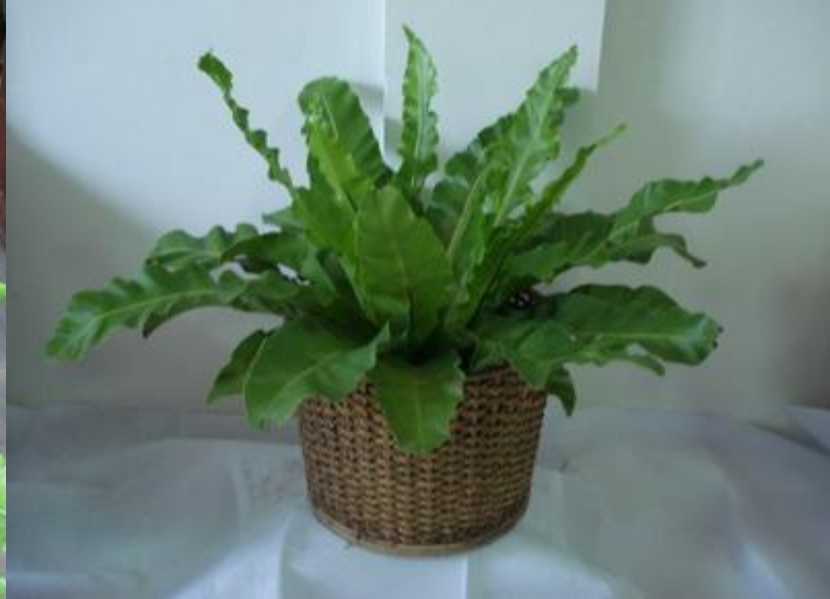
เฟิร์นข้าหลวง