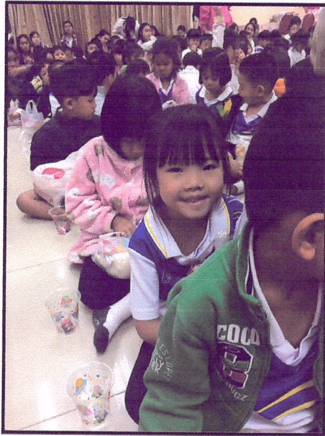
ภาพแสดง : บรรยากาศการร่วมกิจกรรมออมบุญ