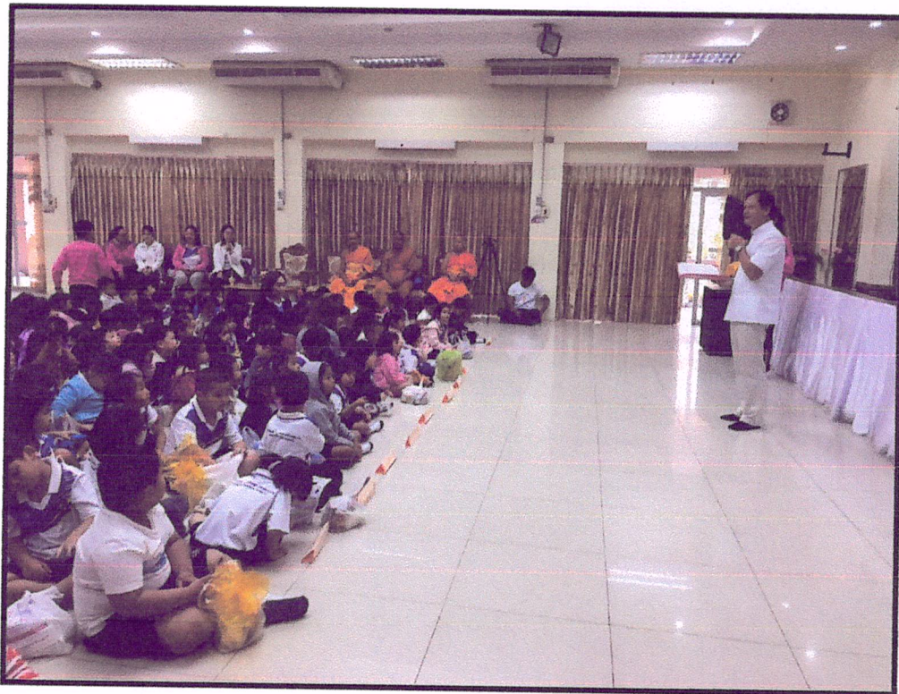
ภาพแสดง : ผู้อำนวยการโรงเรียนสาธิตมหาวิทยาลัยราชภัฏบุรีรัมย์ กล่าวเปิดโครงการธรรมะ ร่วมใจ สร้างสายใยสู่สาธิต ครั้งที่ 4 และบูชาพระรัตนตรัย