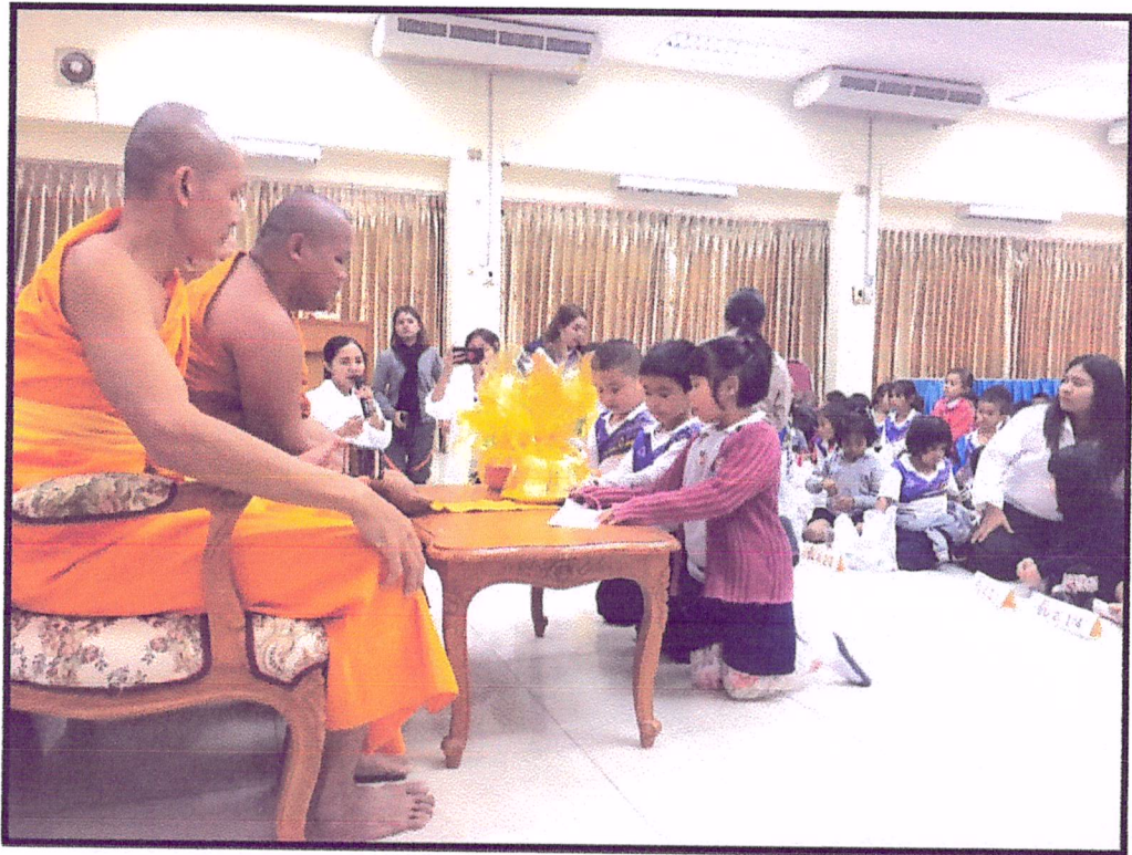
ภาพแสดง : บรรยากาศเด็ก ๆ ร่วมกันถวายชุดสังฆทานแด่พระภิกษุสงฆ์