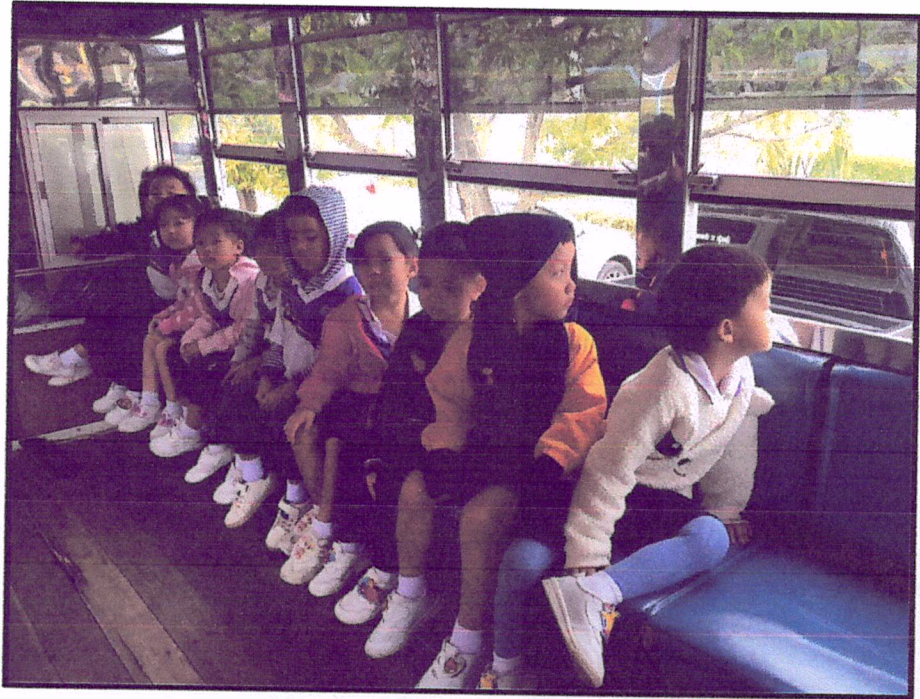
ภาพแสดง : บรรยากาศการเดินทางไปยังห้องประชุมศิवालัย