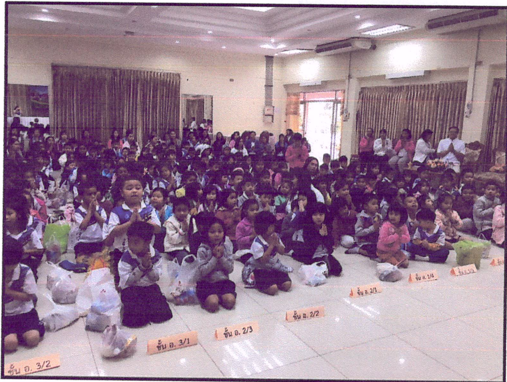
ภาพแสดง : บรรยากาศการอบรมธรรมะ