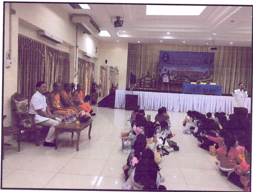
ภาพแสดง : บรรยายภาคการอบรมธรรมะ