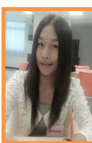
Ao (ดูแลห้อง P1)