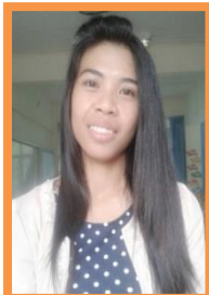
Aeang (ดูแลห้อง P1)