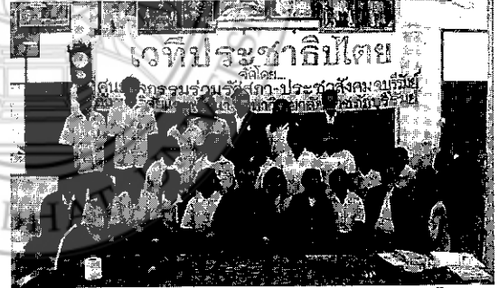
อบรมการทำแผนแม่บทชุมชนและเผยแพร่ประชาธิปไตยที่อ.กัลยา อ.เมือง จ.บุรีรัมย์ (16 ก.พ. 2551)