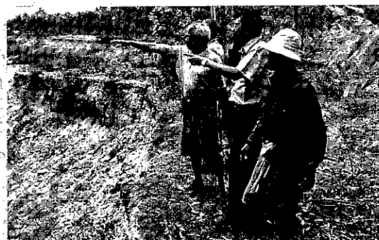
ผอ.สถาบันวิจัยและพัฒนา ลงพื้นที่วิจัยการฟื้นฟูสมน้ำมูลตอนกลาง ต.นิคม อ.สตึก (1 ก.ค. 2550)