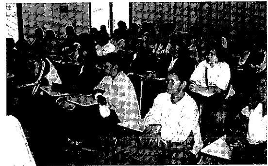
ชาวบ้านพื้นที่วิจัยปัญหาชายแดน จ.สุรินทร์ ดูงานสถาบันวิจัยและพัฒนา (14 ก.พ. 2551)