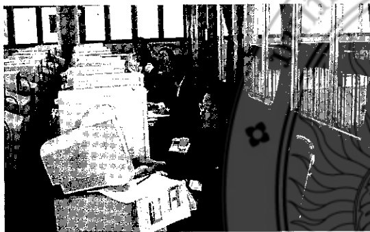
อบรม SPSS (25 ม.ค. 2551)