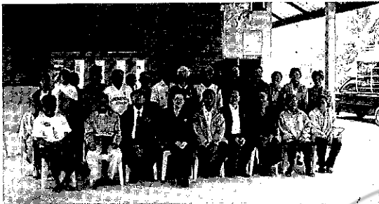
ผู้ทรงคุณวุฒิจากเครือข่ายวิจัย สกอ. มาตรวจเยี่ยมโครงการวิจัยข้าวอินทรีย์ที่บ้านลำไทรน้อย อ.บ้านด่าน (25 ม.ค. 2551)