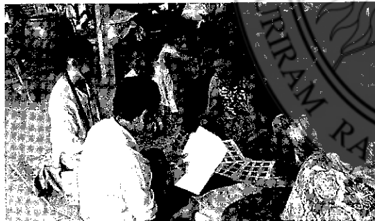
นักวิจัยลงเก็บข้อมูลที่บ้านหนองแม่เม็ด อ.สตึก